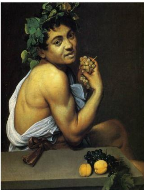
Caravaggio, Young Sick Bacchus , 1593-94

Komposition (2P.), Szenerie (Hintergrund) (1P.), Vielfalt (2P.), Kontrast (2P.), fristgerechte Abgabe (2P.), Schärfeeindruck (0,5P.), korrekte/bewusste Farbwiedergabe (0,5P.)