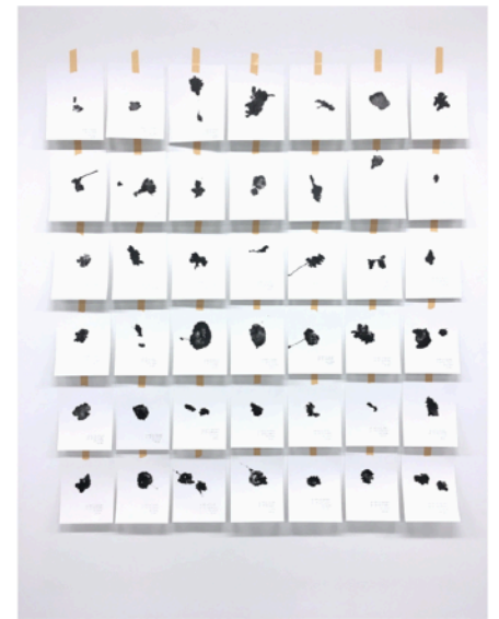
Quelle: Nela Fletcher; Spitography, 42 parts, Toni Areal, Zurich 2019